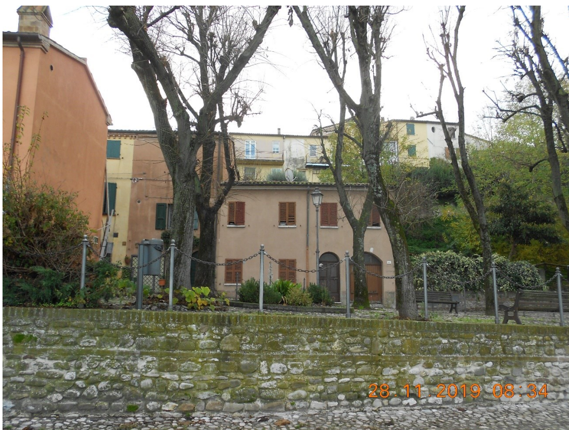
2) Foto di inquadramento da Via Mura Marini e Contrada dei Signori