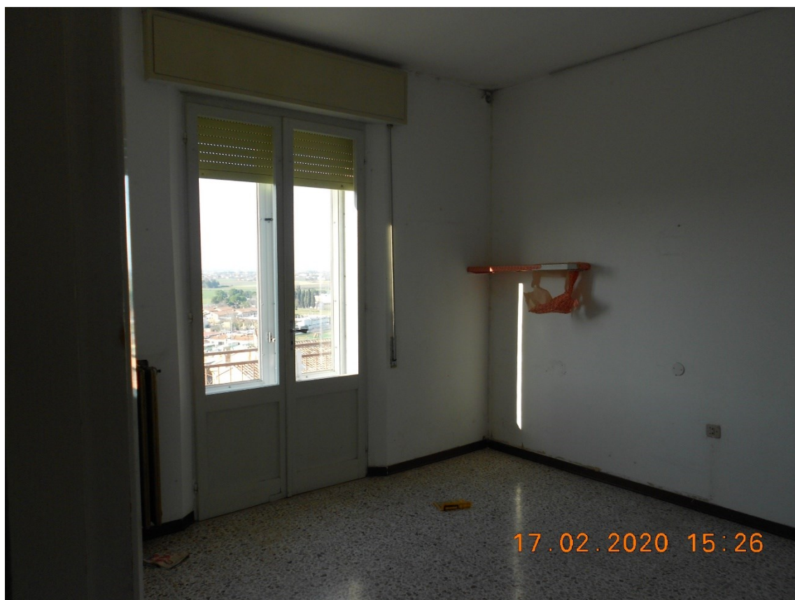
13) Foto interna "locale camera" piano terra