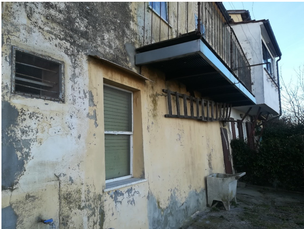
15) Foto esterna aperture 4 e 5 (riferimento w.c. piano seminterrato)