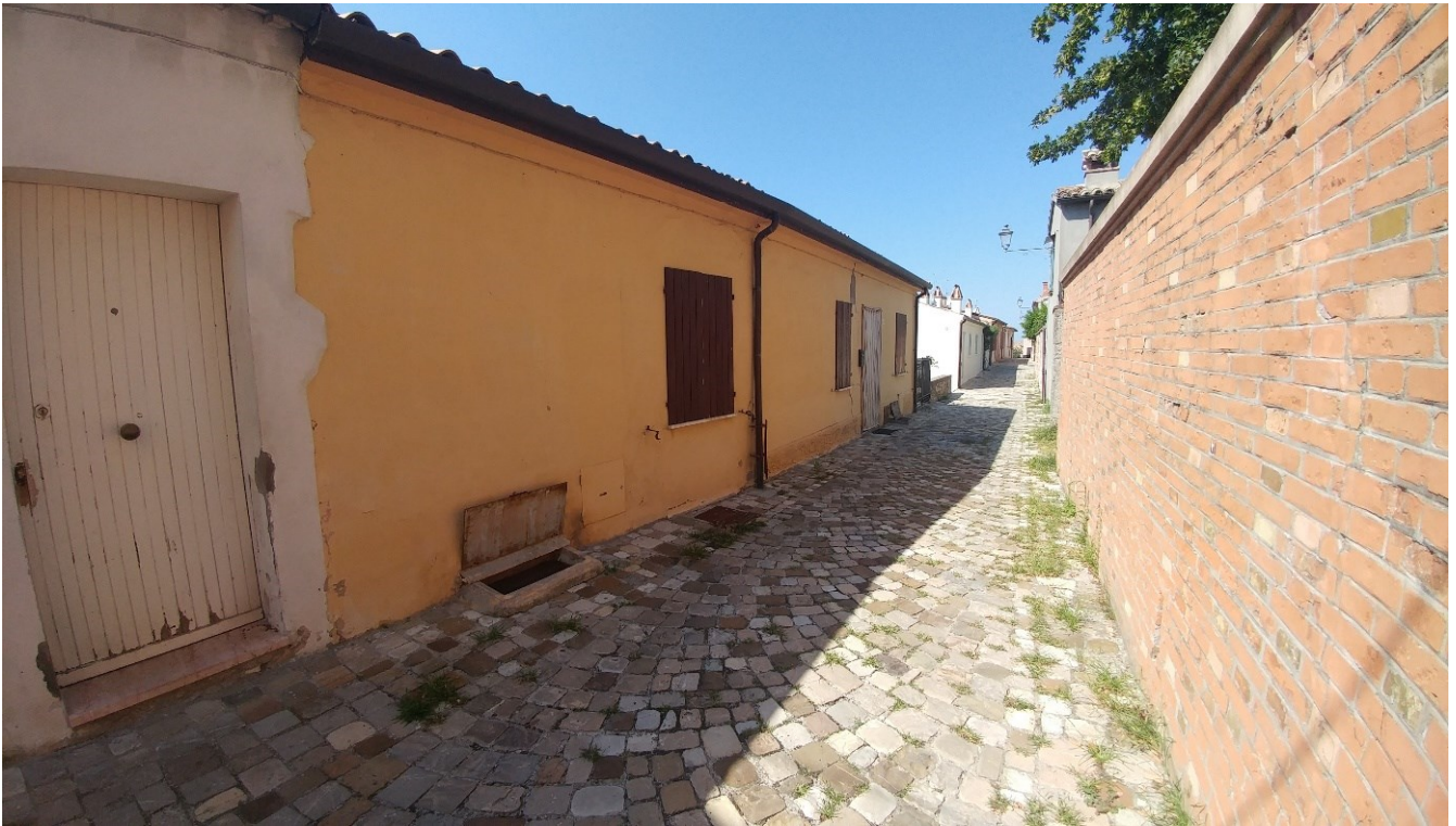
3) Foto prospetto su Via Zuppa