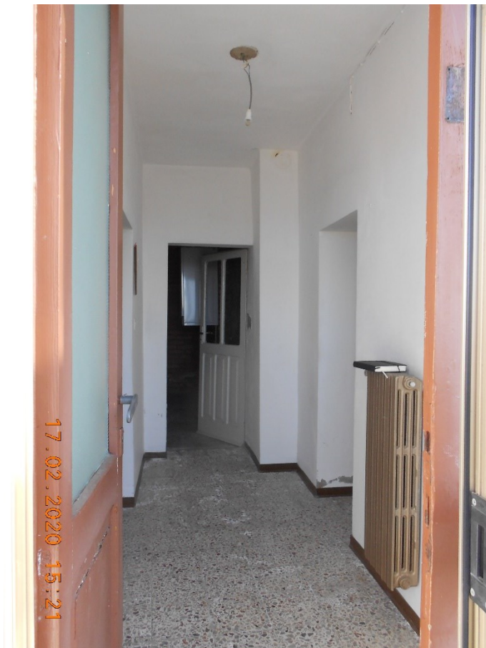
11) Foto interna "ingresso" piano seminterrato