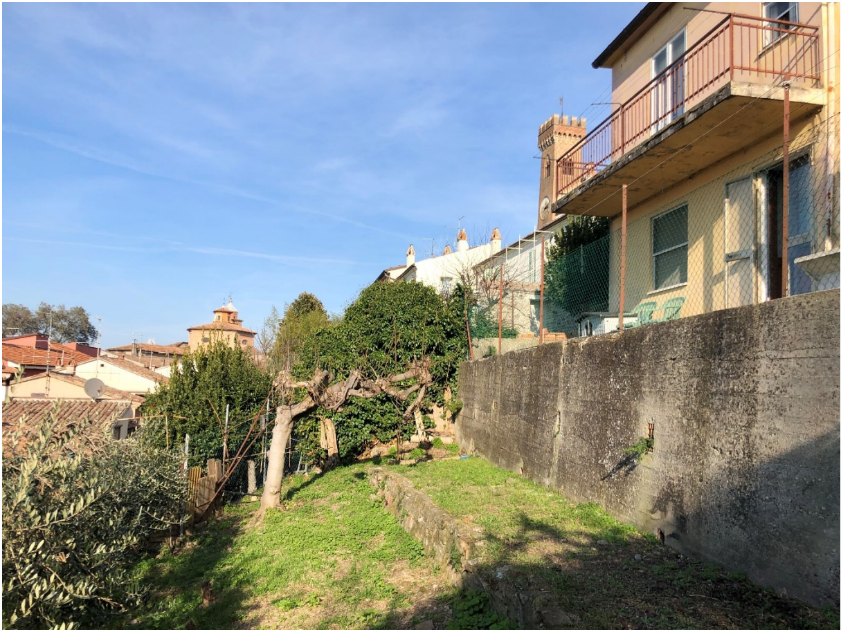
7) Foto prospetto interno da corte esclusiva di pertinenza dell'abitazione