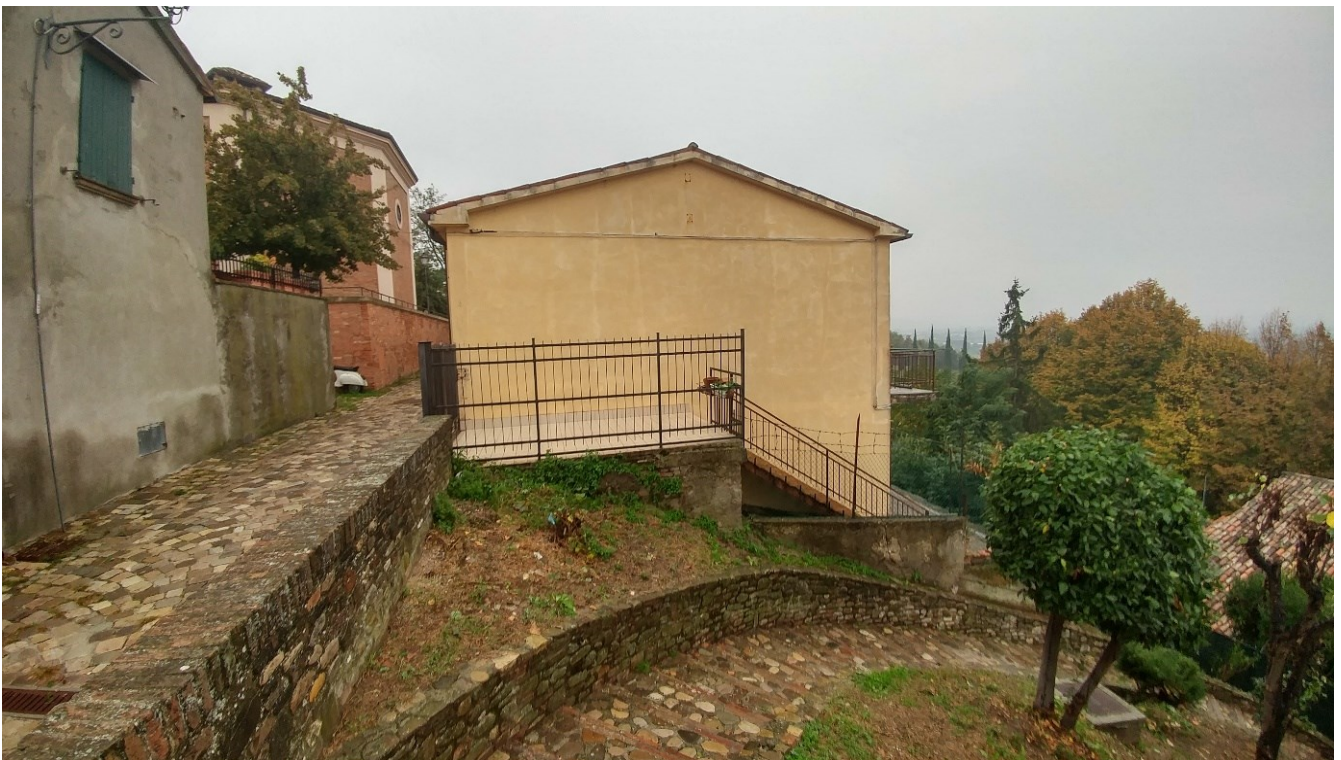
4) Foto prospetto laterale da Via Zuppa