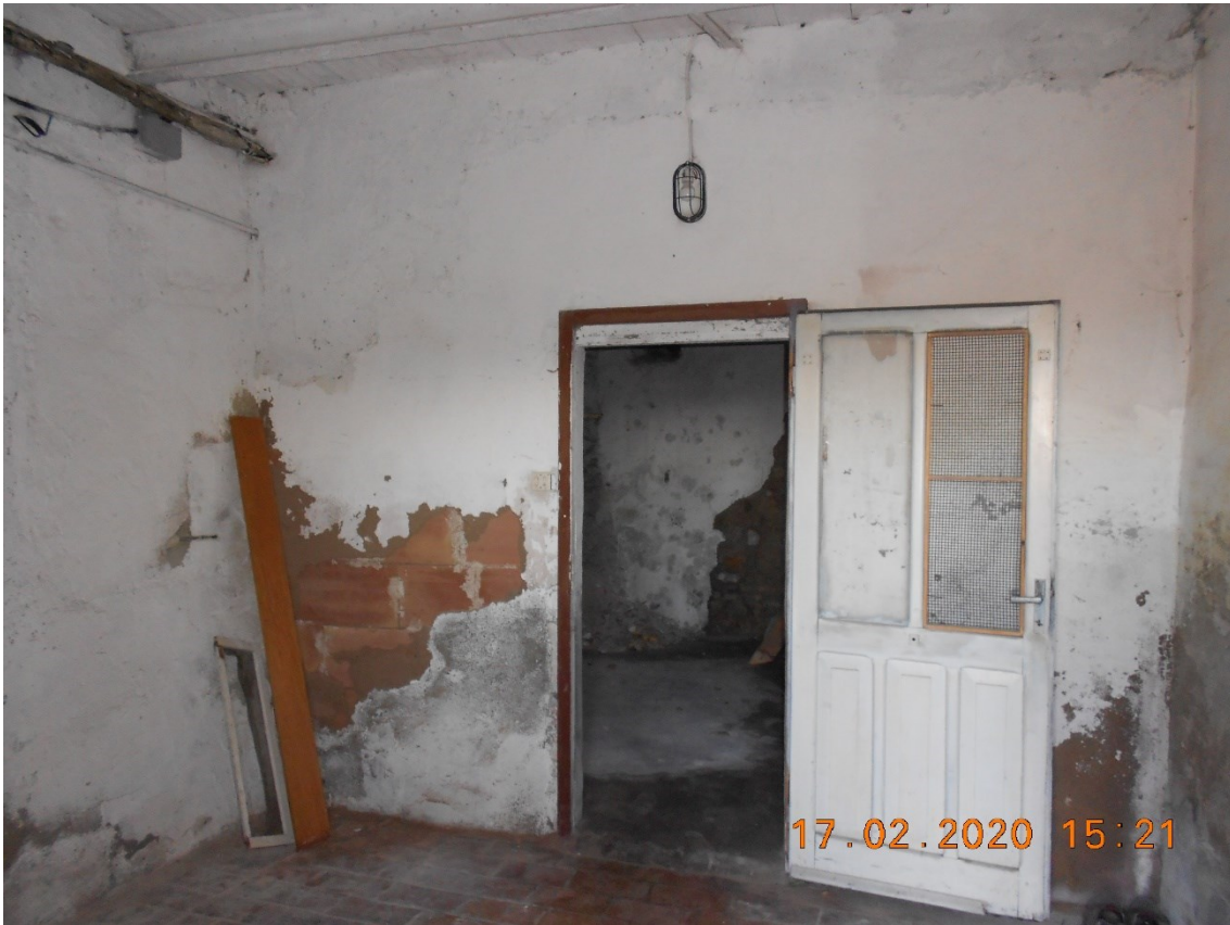
10) Foto interna "locale sgombero" piano seminterrato