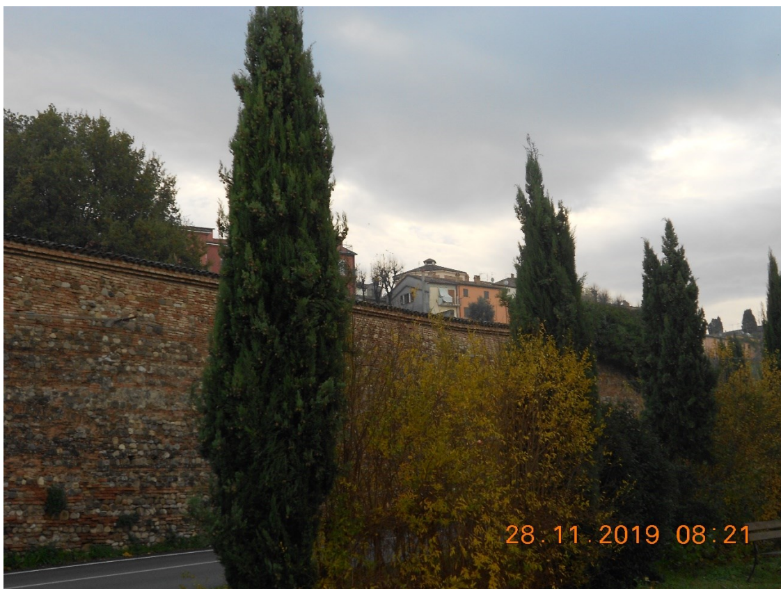
1) Foto di inquadramento da Via Pozzo Lungo