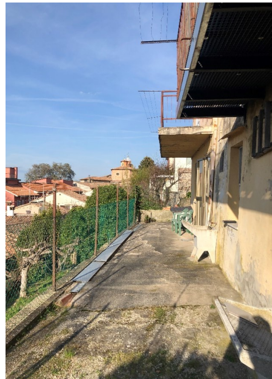
8) e 9) Foto particolari area esterna di pertinenza dell'abitazione