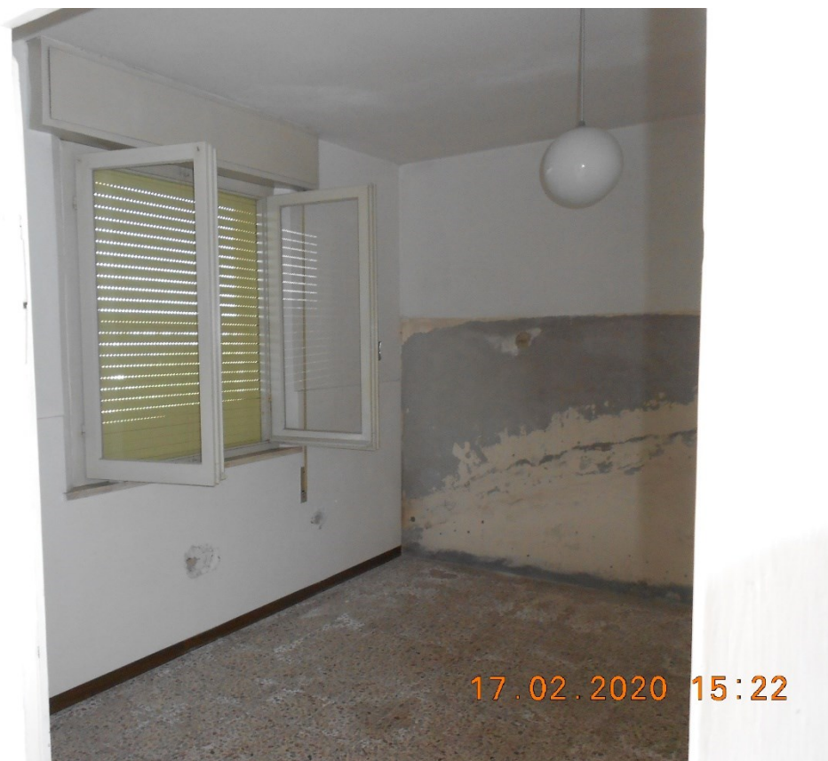
12) Foto interna "locale pranzo" piano seminterrato