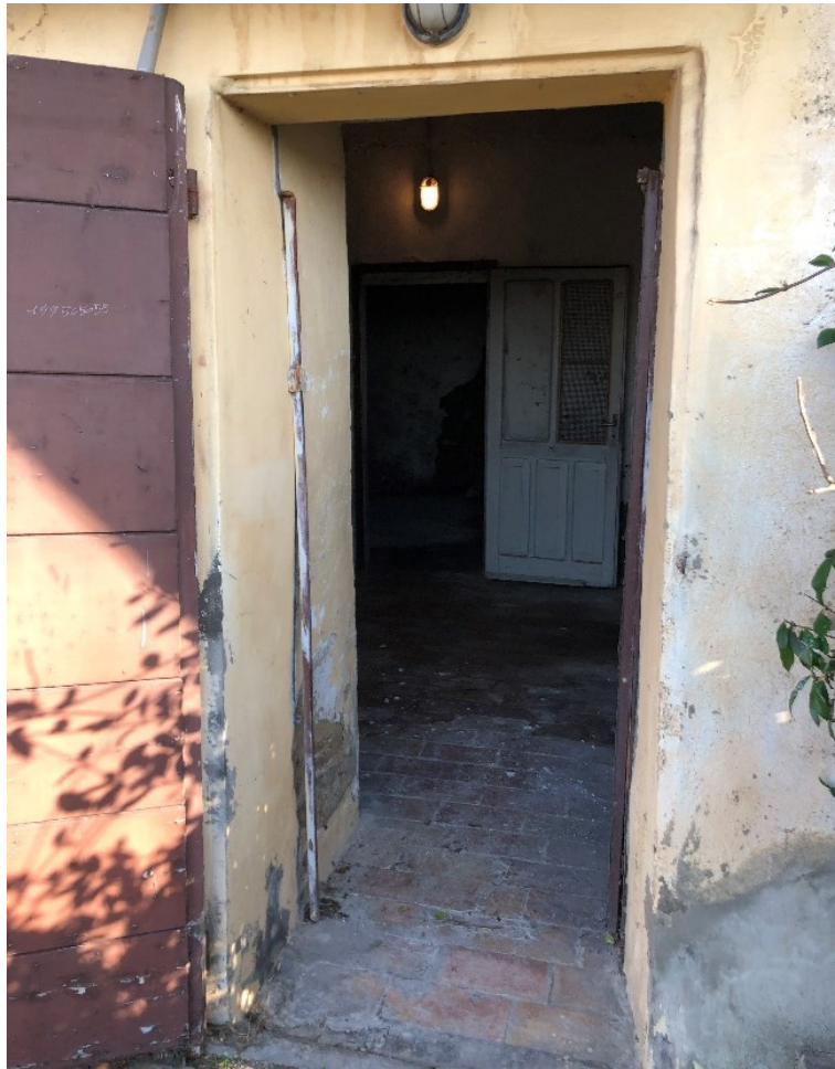
14) Foto apertura 2 (riferimento locale sgombero piano seminterrato)