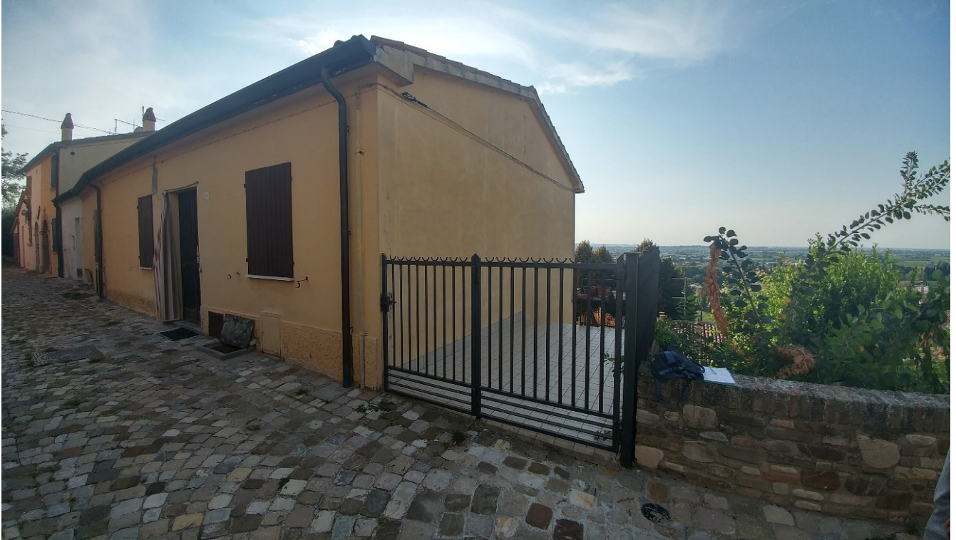
5) Foto prospetto su Via Zuppa