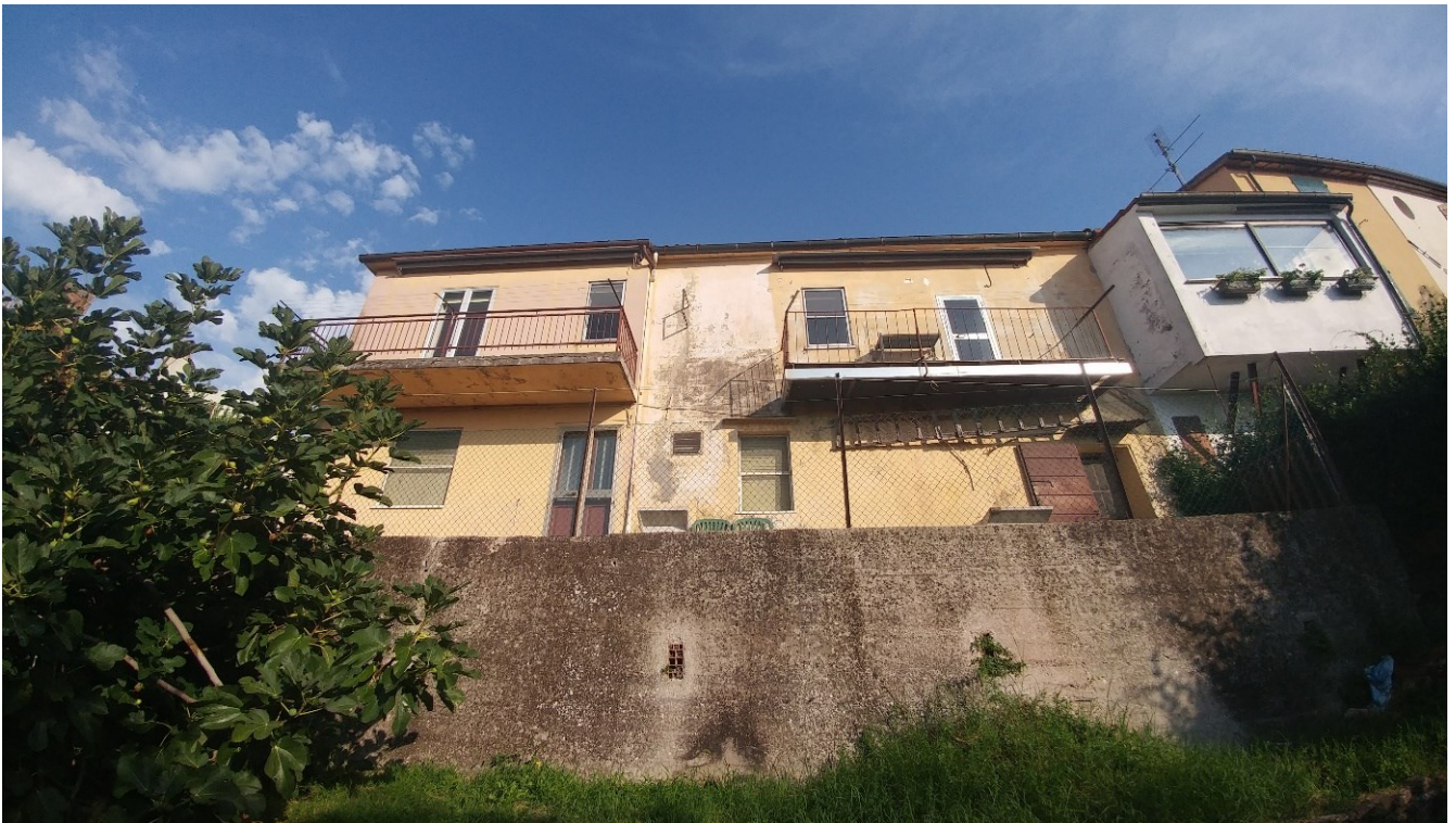
6) Foto prospetto interno da corte esclusiva di pertinenza dell'abitazione